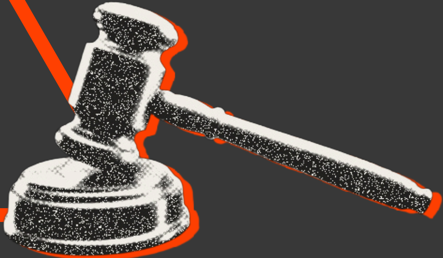
DEN DØMMENDE MAGT (DOMSTOLENE)