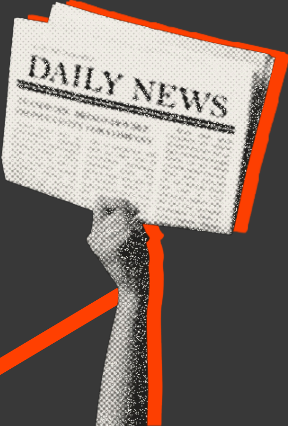
DEN FJERDE STATSMAGT (PRESSEN)