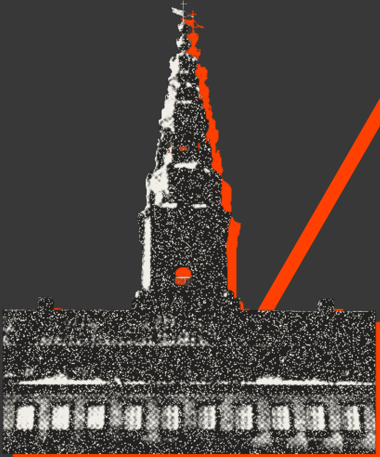
DEN LOVGIVENDE MAGT (FOLKETINGET)