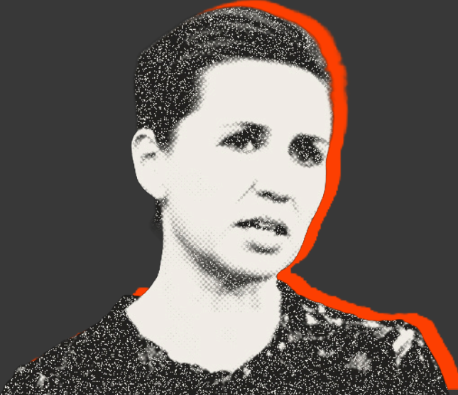
DEN UDØVENDE MAGT (REGERINGEN)